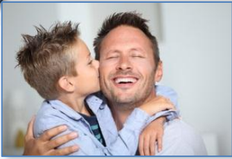
un p apa