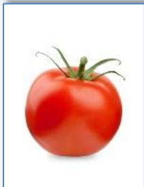
une a tomate