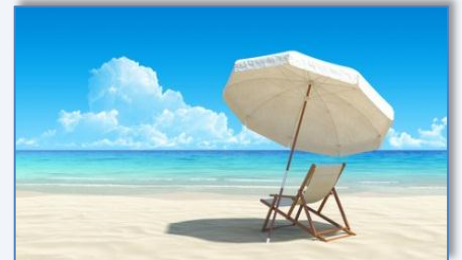
à la plage