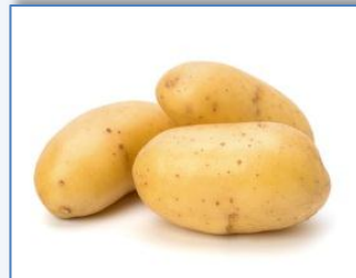
des a patates