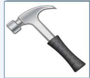
un a marteau