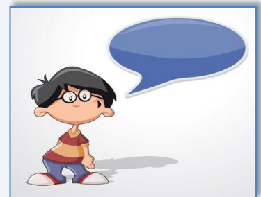
il a parle