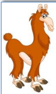
un a lama