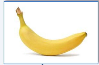
une a nanane