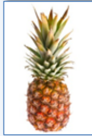
un a nanas