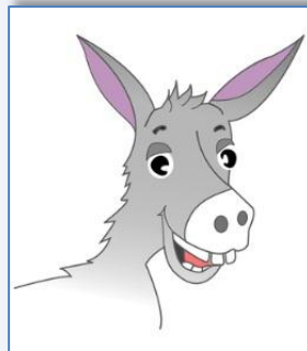
un a âne